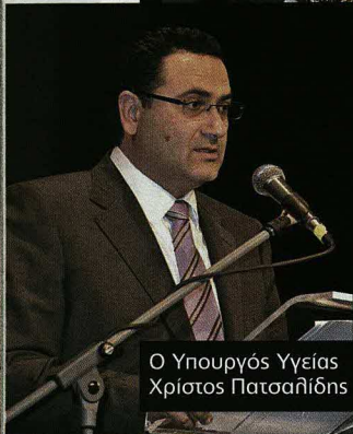
Ο Υπουργός Υγείας Χρήστος Πατσαλίδης