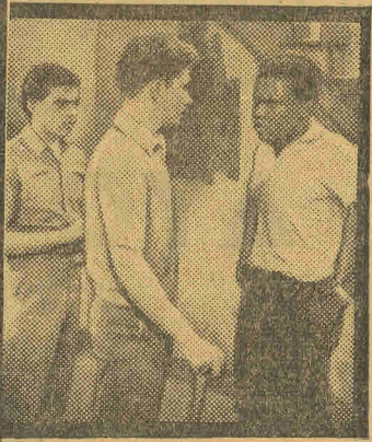
The gang—and the out-siders who can't get in!