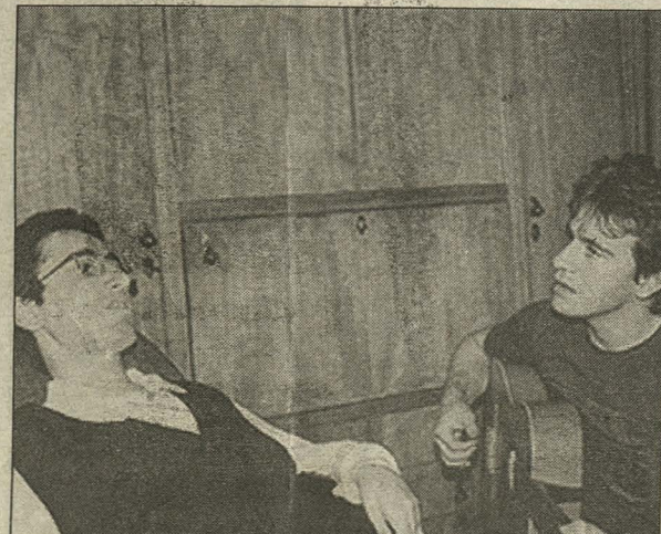
Τραγουδώντας μαζί με τον χρυσό Ολυμπιονίκη μας Δημοσθένη Ταμπάκο που τον συνοδεύει με την κιθάρα του.