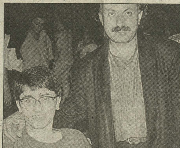
Ο Κύπριος μουσικοσυνθέτης σε μια αναμνηστική φωτογραφία του 1990 με τον Μάριο Τόκα.