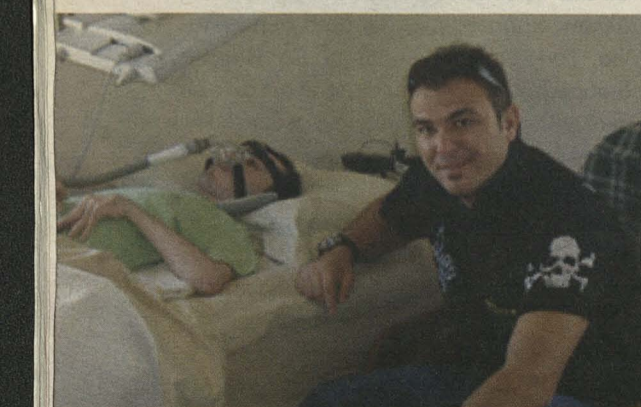
Με τον Αντώνη Ρέμο (2007).