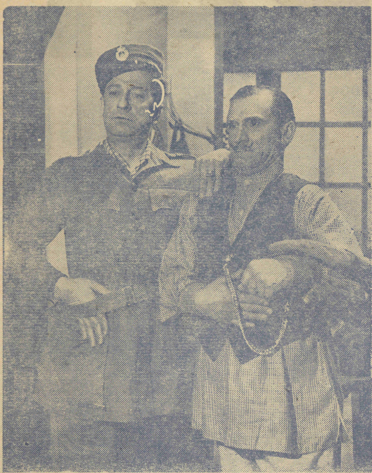
Καμαρώστε τους, ὁ πρόεδρος κί ὁ χωροφυλάκας τοῦ χωριοῦ Κολοπετινίτσας ΚΑΤΖΗΧΡΗΣΤΟΣ - ΦΩΤΟΠΟΥΛΟΣ Ἄμ. πῶς