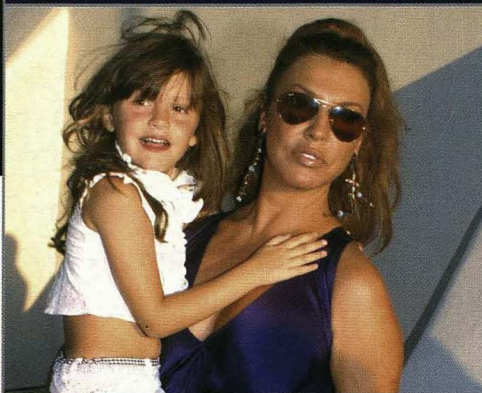
ΠΟΙΟΣ ΑΝΑΣΤΑΤΩΣΕ ΤΗ ΖΩΗ ΤΗΣ;