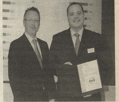
ρωπαϊκή Έδρα της είναι στο Μόναχο της Γερμανίας.

Η J.D.Power & Associates, όπως είναι το πλήρες όνομά της, είναι μία εταιρεία παγκόσμιας εμπέλειας που ειδικεύεται στην Έρευνα Αγοράς και τις υπηρεσίες Marketing. Ειδικότερα, κατέχει ηγετικό ρόλο στις έρευνες ικανοποίησης πελατών, που βασίζονται σε επεξεργασία ερωτηματολογίων από εκατοντάδες χιλιάδες ή και εκατομμύρια συμμετέχοντες. Η Ευ-