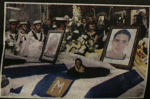
Όλη η Κύπρος τίμησε τα 13 παλληκάρια που έχασαν τη ζωή τους στη Ναυτική Βάση «Ευάγγελος Φλωράκης» στο Μαρί ▶9