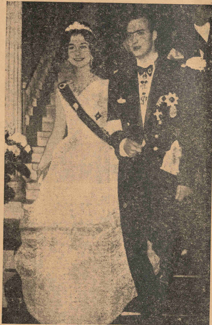
Εισιτήρια από ΟΝΤΕΟΝ και ΓΙΑΝΝΟΠΟΥΛΟΥ

Ανεβαίνοντας στο ΠΡΩΤΟ σκαλοπάτι θα νοιώσης πόνο, στο ΔΕΥΤΕΡΟ θα γελάσης, στο ΤΡΙΤΟ θα πονέσης, στο ΤΕΤΑΡΤΟ θα δακρύσης.