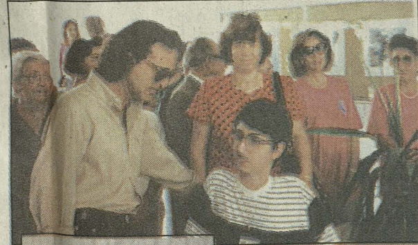
Πάνω δεξιά: Με το Μάρκο Τζάκα, με το Γιώργο Νταλάρα, ο οποίος προλόγισε το νέο του δίσκο «Κασταλίας και Σειρήνων». Αριστερά με τον Κώστα Κακογιάννη.

δεν ήθελεν να ξεκινήσω πιάνο για να μην αναγκαστώ να το διακόψω. Ετσι μου αγόρασαν ένα μικρό αρμόνιο όταν ήμουν δέκα χρόνων και από τότε ξεκίνησα να παίζω συστηματικά και να κάνω μαθήματα. Ερχόταν στο σπίτι μας ο Σάββας Κωνσταντινίδης ο οποίος μου έκανε μαθήματα, ένας πολύ καλός άνθρωπος και μουσικός με τον οποίο είμαστε φίλοι μέχρι σήμερα. Μου έδωσε πολύ καλές βασικές, έμαθα να διαβάζω νότες, να γράφω συνθέσεις και σιγά σιγά να μπαίνω με εφόδια και γνώσεις στη μουσική και όχι να ασχολούμαι πρακτικά όπως έκανα μέχρι τότε. Ο δάσκαλος μου ήξερε ότι δεν μπορούσα να γίνω εκτελεστής οργανού λόγω του προβλήματός μου και μου έδωσε όλες τις βασικές που χρειαζόμουν για να συνεχίσω και στη σύνθεση και στην ενορχήστρωση. Εκείνη την περίοδο ανακάλυψα το ταλέντο να τραγουδά και ένα από τα μεγαλύτερα μου πρότυπα ήταν ο Νταλάρας. Μάλιστα τραγουδούσα όλα τα τραγούδια του και εμπνεύσομαι από αυτό το είδος, το ελαφρολόγιο, τις μπαλάντες και σε λιγότερο βαθμό από κλασικά κομμάτια, αν και μου άρεσε η κλασική μουσική αλλά πολύ επιλεγμένη.