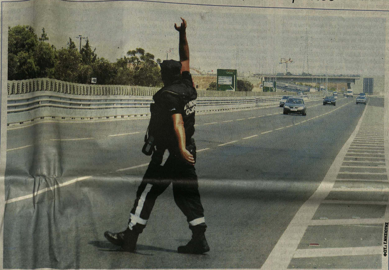
Πρόσπμο-μάθημα για τις τρεις λωρίδες Αφού δεν έμαθαν οι οδηγοί με τα ενημερωτικά φυλλάδια πώς να χρησιμοποιούν τις τρεις λωρίδες κυκλοφορίας στον αυτοκινητόδρομο, η Τροχαία επέκρινε από χθες να τους το εμπέδωσει με εξώδικα των 65 ευρώ. Συνολικά 54 οδηγοί πήραν τη λυπητερή, ενώ από το μεσημέρι παρατηρήθηκε συνωστισμός στην αριστερή λωρίδα που πριν ήταν... άδεια.

ΕΝΤΟΝΗ πολιτική αντιπαράθεση, συνέχεια στη σύγκρουση Κυβέρνησης - Ορφανίδη και ένα συνδικαλιστικό κίνημα που ετοιμάζει αντιμνημονιακές κινήσεις, είναι τα όσα χαρακτηρίζουν το σκηηνικό στην Κύπρο, αμέσως μετά την αποχώρηση της Τρόικας. Ο Πρόεδρος της Δημοκρατίας, αν και στο Λονδίνο, δεν απέφυγε την πρόκληση από όσα κατέθεσε στη Βουλή και δήλωσε δημόσια, ο τέως διοικητής της Κεντρικής Τράπεζας, Ο κ. Χριστόφιας καταγόρησε τον κ. Ορφανίδη ότι ποτέ δεν τον ενημέρωσε για την κατάσταση των επεν-