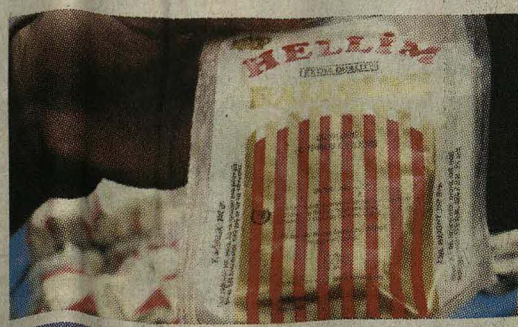
Κατοχύρωση Στο νέο φάκελο της Κύπρου, θα υπάρξει και η λέξη hellim >>>20

ΕΥΡΩ -παράθυρο για επίσημη κατοχύρωση δικαιωμάτων της Τουρκοκυπριακής κοινότητας στο ζήτημα της παραγωγής χαλλουμιού ανοίγουν οι Βρυξέλλες, οι οποίες αποφάσισαν σύμφωνα με πληροφορίες του «Φ», να επιβάλουν στην Κυπριακή Δημοκρατία όπως εμπλέξει την τουρκοκυπριακή κοινότητα σε μια ενδεχόμενη νέα αίτηση για «Προστατευόμενη Ονομασία Προέλευσης» του προϊόντος. Σε γραπτή της τοποθέτηση, η Κομισιόν, υποδεικνύει ότι «σε περίπτωση υποβολής μιας νέας αίτησης για εγγραφή (σ.σ. του χαλλουμιού) από την Κυπριακή Κυβέρνηση, οι Τουρκοκυπριοί παράγοντες θα πρέπει να εμπλακούν στο πλαίσιο μιας διαδικασίας διαβούλευσης που θα προηγηθεί, η οποία θα πρέπει να λάβει χώρα σε εθνικό επίπεδο, σύμφωνα με το άρθρο 5, παρ. 5 του Κανονισμού 510/2006». Από την τοποθέτηση της Κομισιόν, προκύπτει ευθέως ότι οι Βρυξέλλες θεωρούν ως επιβεβλημένη την εμπλοκή της τ/κ κοινότητας στην κατοχύρωση της Προστατευόμενης Ονομασίας Προέλευσης του χαλλουμιού, αλλά ότι η διαδικασία θα γίνει υπό την ομπρέλα της Κυπριακής Δημοκρατίας. Η Κυβέρνηση υποχρεούται μάλιστα, στο πλαίσιο του προαναφερθέντος Κανονισμού 510/2006, «...να εξασφαλίσει