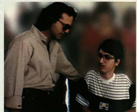
Με τον Γιώργο Νταλάρα το 1991.

• Το 1999 συνεργάστηκε με τη Συμφωνική Ορχήστρα του Κρεμλίνου και το μαέστρο Pavel Ovjianpicon στο δεύτερο προσωπικό του δίσκο με τίτλο «Υπέρβαση», ο οποίος περιέχει ορχηστρική μουσική. ■