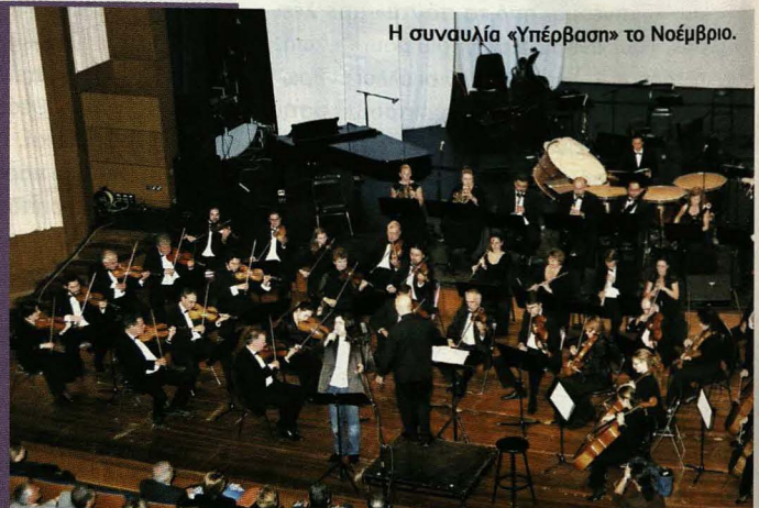
Η συναυλία «Υπέρβαση» το Νοέμβριο.

Απ' το παράθυρό μου φεύγω, σαν αετός ψηλά πετώ ψάχνω να βρω το όνειρό μου κι όλο τον άνεμο ρωτώ πού να 'ναι η χαρά κρυμμένη κι αυτός μου λέει, «θα το δεις, σ' όλο τον κόσμο κι αν την ψάξεις μες στην καρδιά σου θα τη βρεις».