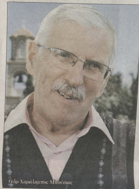
Ο Δρ Χαράλαμπος Μπούσιος