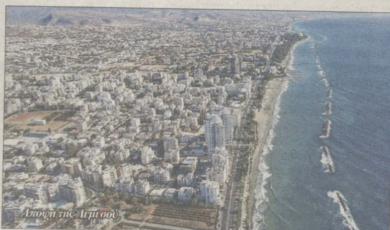
Άποψη της Λεμεσού