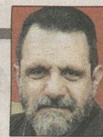
Από τον ΓΙΑΝΝΗ ΖΑΝΝΗ