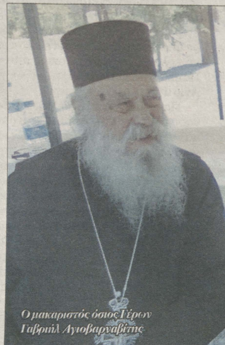
Ο μακαριστός Όσιος Γέρον Γαβριήλ Αιγιοβαρνάβη

Είχα διαβάσει πρόσφατα ένα ιδιαίτερα καλλιτέπεια κείμενό σας με τον τίτλο «Μαθητεία». Θα θέλατε να μας πείτε καταρχάς γιατί επιλέξατε έναν τέτοιο τίτλο;