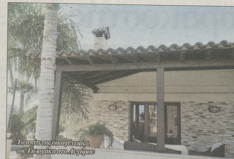
Το σπίτι της οικογένειας του Γιωργάκη στο Αυγόρου