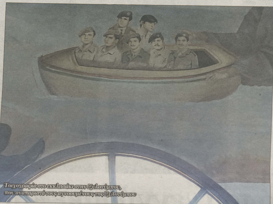
Το γιογραφία στο επάγγελμα των Φιλοσόφων, που αναπαριστά τους αγνοούμενους της Ξελαστίμης