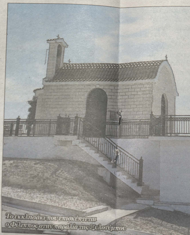
Το εκκλησάκι που επισκεπτάται ο Φίλιππος σαν παράλι της Ξελαστίμης