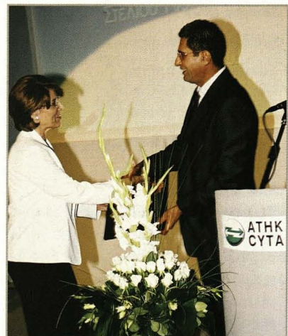
Ο Πρόεδρος της ΑΤΗΚ δίνει αναμνηστικό δώρο στη μητέρα του Στέλιου

Για την παρουσίαση του δίσκου ταξίδεψε από την Ελλάδα ο Χρυσός Ολυμπιονίκης Δημοσθένης Ταμπάκος, στενός φίλος του Στέλιου, ο οποίος σε βιβλίο που τοποθετήθηκε στο χώρο για ευχές στο Στέλιο έγραψε: "Καρδιά με Καρδιά, Φως με Φως, Δημιουργία, Δύναμη, Αγάπη, Ζωή."