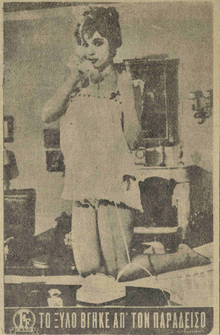
ΤΟ ΞΥΛΟ ΒΓΗΚΕ ΑΠ' ΤΟΝ ΠΑΡΑΔΕΙΣΟ

Έχω ένα μυστικό κρυμμένο στης καρδιάς τα βάθη κανείς δέν θα το μάθει και ποτέ δέ θα το πώ Νά μείνη θέλω πάντα δικό μου το μυστικό μου Αυτό το μυστικό το γλυκό μου που τ' αγαπώ Έχω ένα μυστικό που όλα τα όμορφαίνει και πρώτη μου φορά με πλημμυρίζει χαρά Έχω ένα μυστικό που στη ματιά μου μέσα λάμπει το ξέρουνε οί κάμποι τώχει μάθει το βουνό το τραγουδούν την νύχτα στά κλώνια όλα τ' άηδόνια κι' όλο το γραφουν τα χελιδόνια στον ουρανό Έχω ένα μυστικό που τη ζωή μου έχει αλλάξει μα δέν τόχω σκοπό ποτέ μου να σάς τό πώ