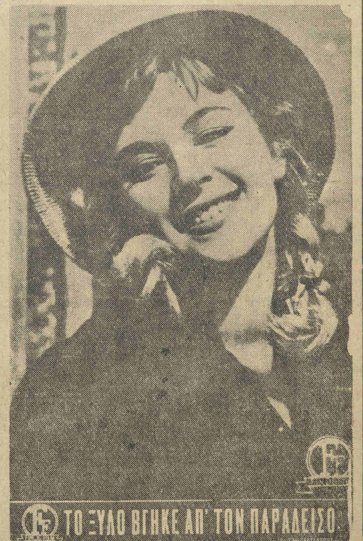
ΤΟ ΞΥΛΟ ΒΓΗΚΕ ΑΠ' ΤΟΝ ΠΑΡΑΔΕΙΣΟ

Αλίκη Βουγιουκλάκη ΔΙΕΚΟΝ ΣΑΚΕΝΛΑΡΙΟΥ ΤΟ ΞΥΛΟ ΒΓΗΚΕ ΑΠ' ΤΟΝ ΠΑΡΑΔΕΙΣΟ!